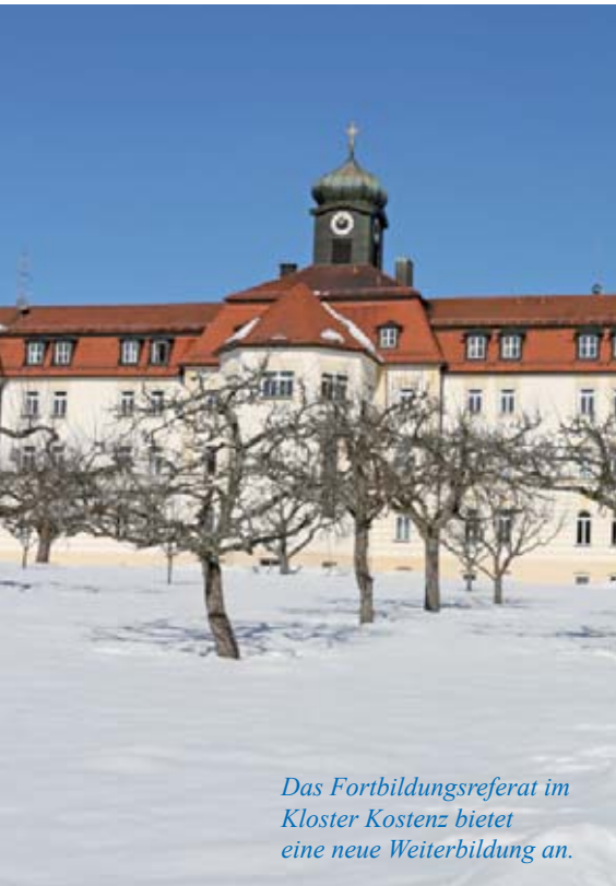
Das Fortbildungsreferat im Kloster Kostenz bietet eine neue Weiterbildung an.

Im Kompetenzteam Fortbildung der Barmherzigen Brüder Behindertenhilfe GmbH wurde die in den Jahren 2004 und 2007 bereits zweimal durchgeführte Fachweiterbildung „Heilerziehungspfleger für Menschen mit psychischer Behinderung“ überarbeitet und unter dem Titel „Professionelle Begleitung von Menschen mit psychischer Behinderung und Krankheit sowie autistischen Spektrum-Störungen“ neu gestaltet.