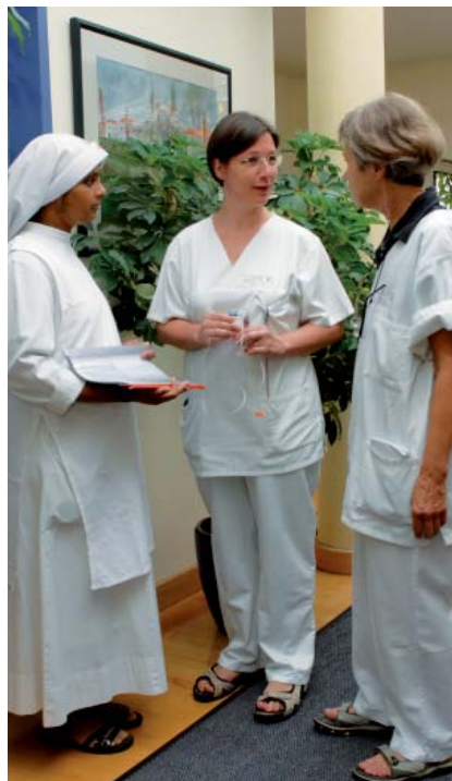
Pflegekräfte auf der Palliativstation St. Johannes von Gott im Gespräch

Ganz persönliche Motivationsfaktoren spielen ebenso eine Rolle: Schlüssel-erlebnisse und der Wunsch, „Sterben anders kennenzulernen“ bzw. den „Umgang mit der eigenen Sterblichkeit zu lernen“. Als besonders motivierend wird die Qualität der Beziehungen empfunden, sowohl zu den Patientinnen und Patienten als auch im Team. Auch spirituelle Aspekte spielen eine Rolle: Den befragten Mitarbeitern geht es darum, „vom Glauben getragen zu werden“, Zusammenhänge zu begreifen und Erfüllung bzw. sich selbst zu finden. Die spirituelle Atmosphäre auf der Station und die Sinnhaftigkeit der Palliativarbeit nehmen sie dabei als sehr hilfreich wahr.