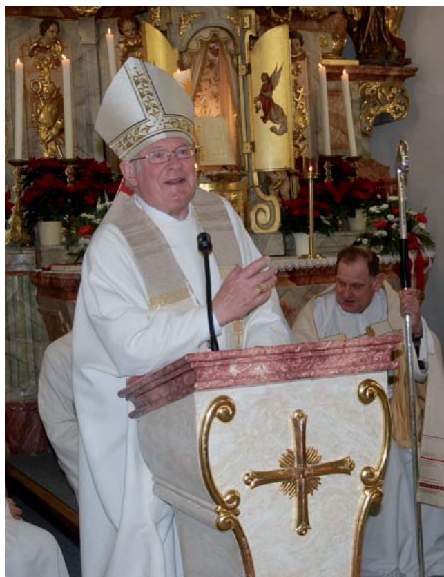
In seiner Predigt forderte der Weihbischof die Zuhörer auf, sich in der Tugend der Demut zu üben.