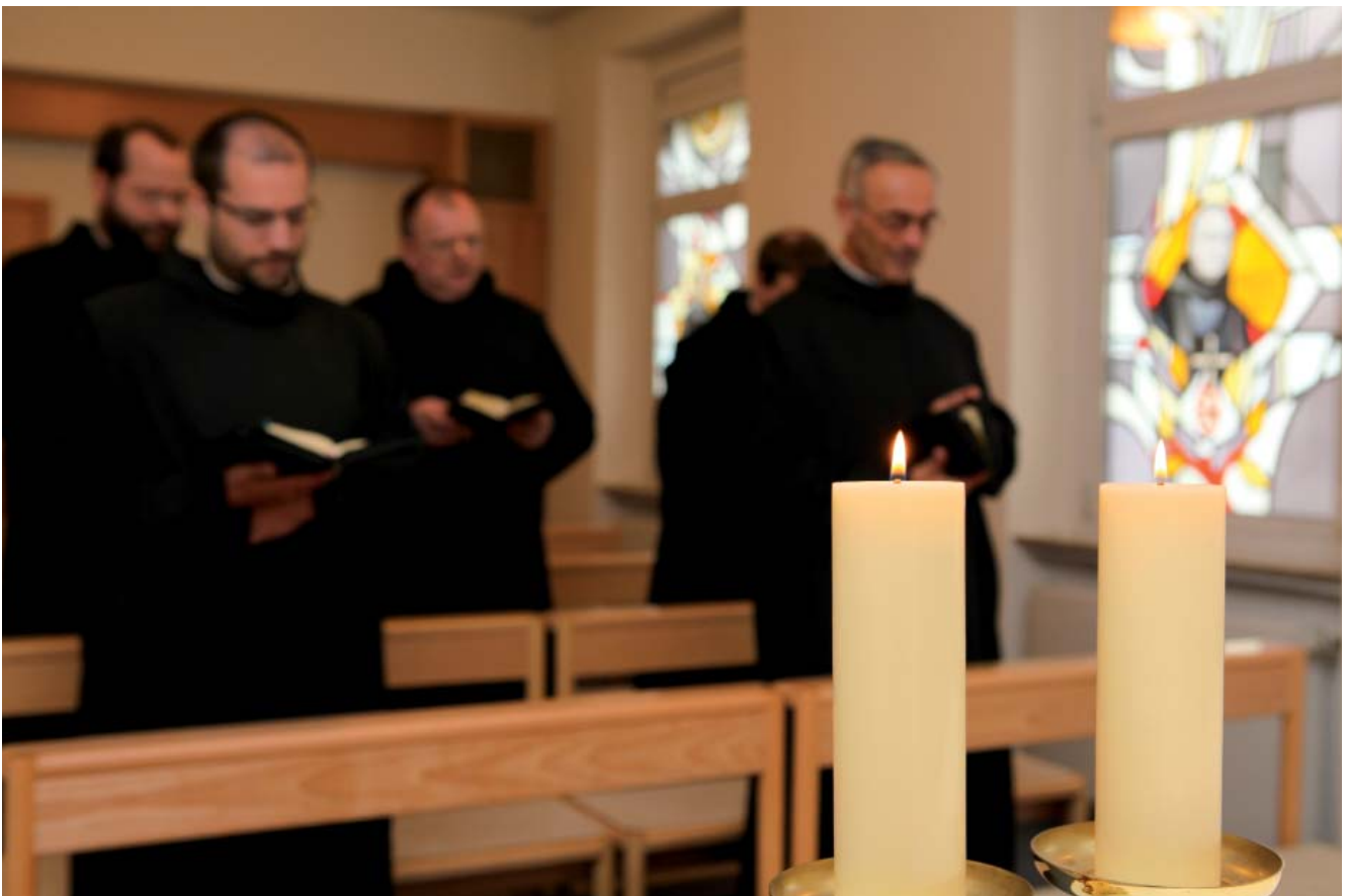
Foto unten: Barmherzige Brüder des Regensburger Konvents beim Gebet